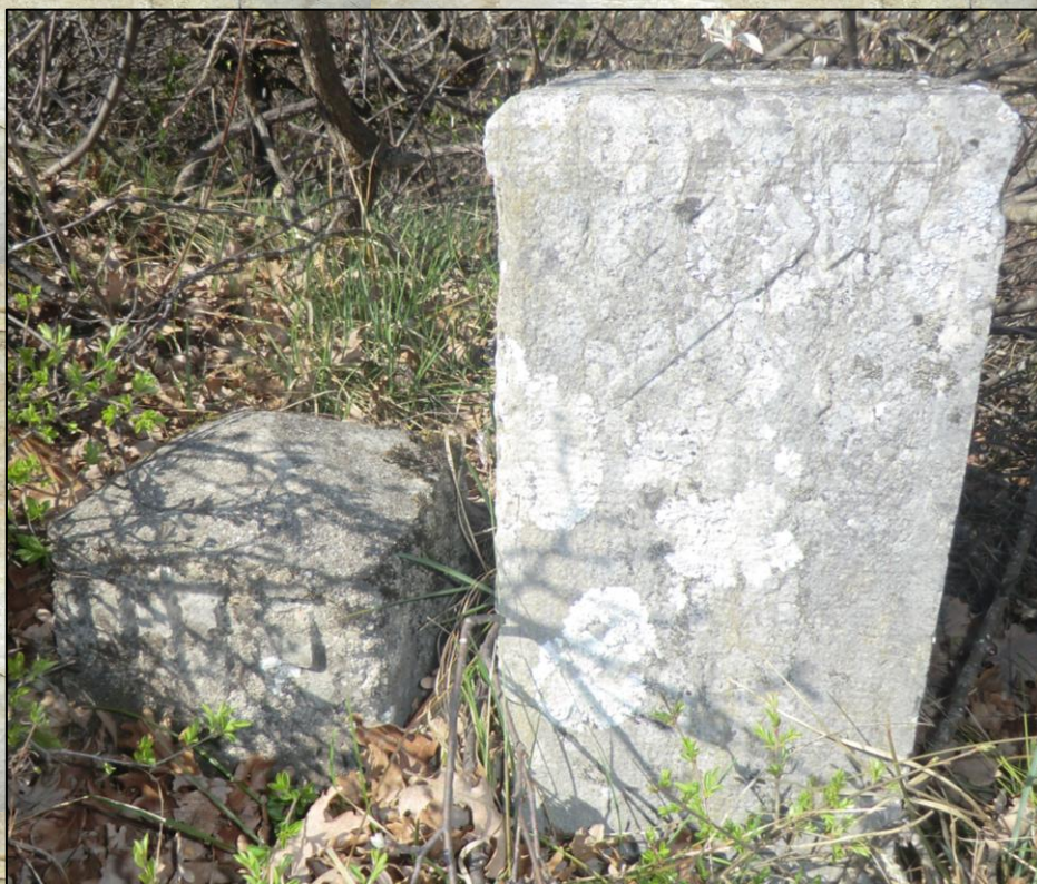
Cippo servito per le misurazioni dei campi minerari "Emilia" e "Maria" (lato rivolto a sud)